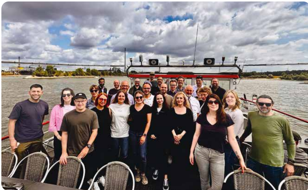
Eine Hafenrundfahrt, die ist lustig – aber auch lehrreich für das Team der Wirtschaftsentwicklung.

Sportstadt Duisburg: Mit großem Aufgebot nahm die DBI am Firmenlauf teil.