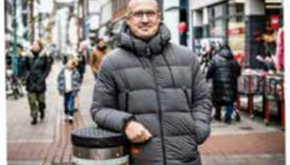
Im Zentrum steht die Chefsache der Citymanager: die Probleme der Bürger. In der vergangenen Woche gab es viele Beispiele für die Chefsache.

Mit Verleihen, Buslinien und anderen Maßnahmen machen Citymanager die Probleme der Bürger zur Chefsache