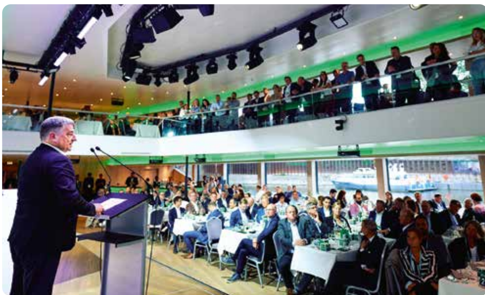
Thyssenkrupp-CEO Miguel López bei der Auftaktgala des Hy.Summit.Rhein.Ruhr in Duisburg

Der dritte Konferenztag des Hy.Summit.Rhein.Ruhr fand am 19. Februar 2026 in Hamm als Hy.Lab statt.