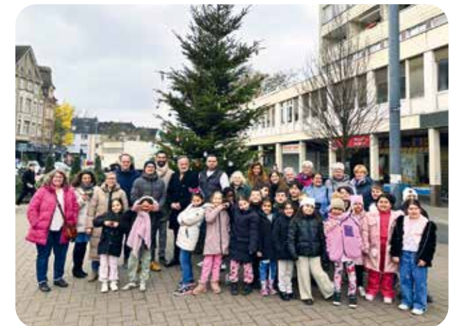
Stärkung der Lebendigkeit auch in den Stadtteilen: Adventsaktion mit dem TIAD auf dem Hamborner Altmarkt