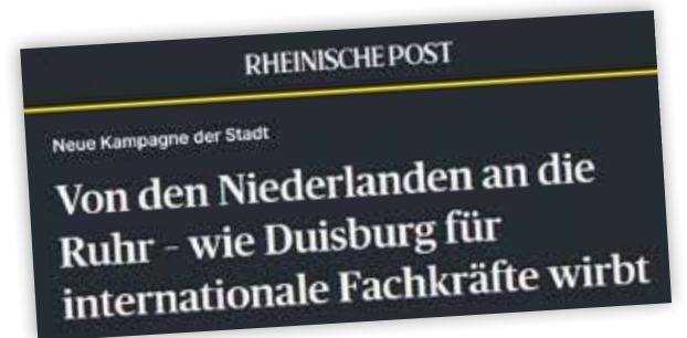
Standortmarketingkampagne, Wasserstoff, Citymanagement, Start-ups: Die Arbeit der DBI erzeugt breite mediale Aufmerksamkeit.