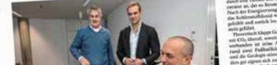
Factor2 Energy ist ein Start-up aus Duisburg, das Millionen Euro aus den USA erhalten hat. Das Team arbeitet an einer revolutionären Idee zur Gesteinerne vorantreiben.

Factor2 Energy will mit einer revolutionären Idee zur Gesteinerne vorantreiben. Was sie komplett anders machen.