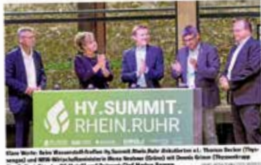
Einige Vertreter des Wasserstoff-Gipfels im Hy-Summit.Rhein.Ruhr diskutierten über die Chancen des Wasserstoffbaus...